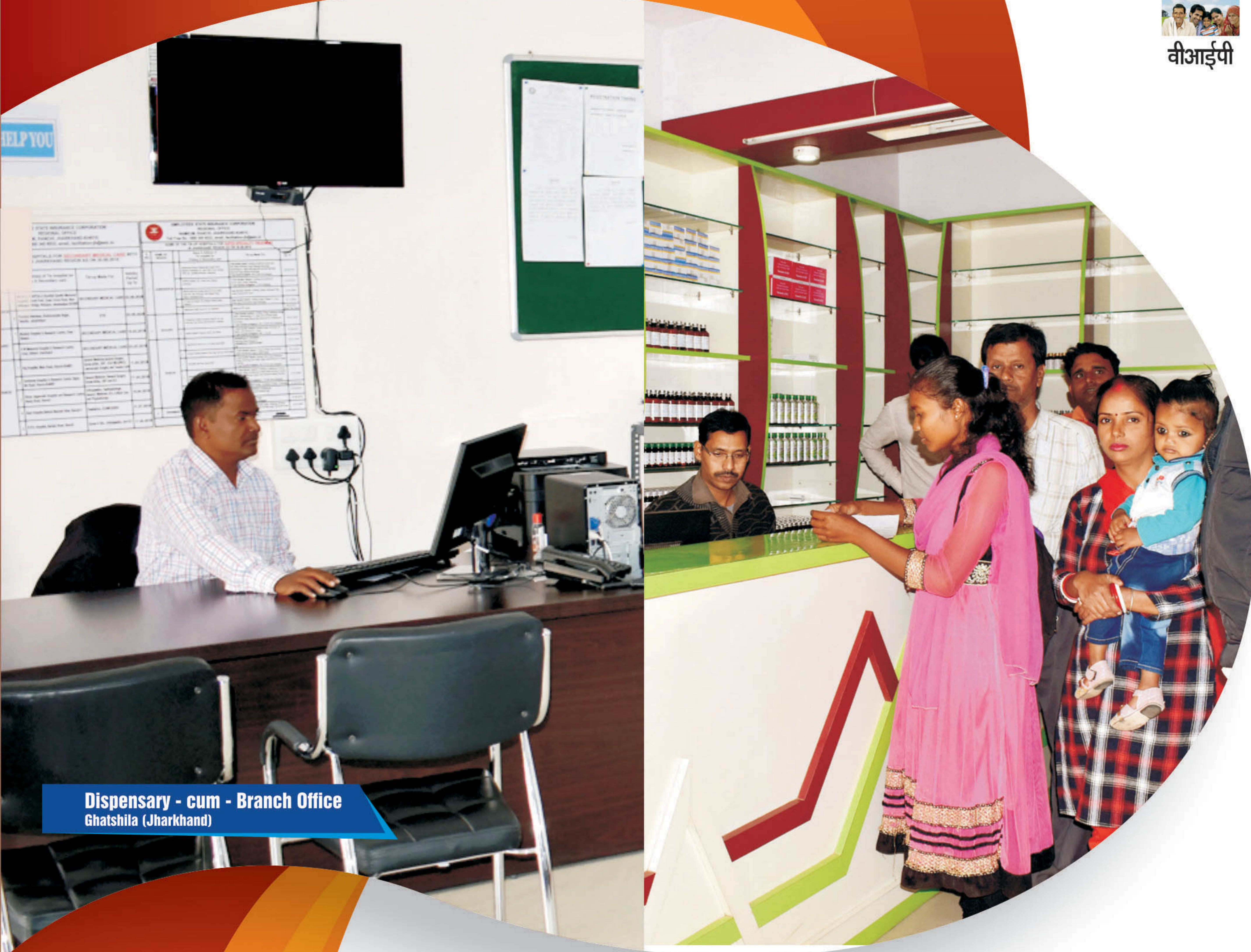
Dispensary - cum - Branch Office Ghatshila (Jharkhand)